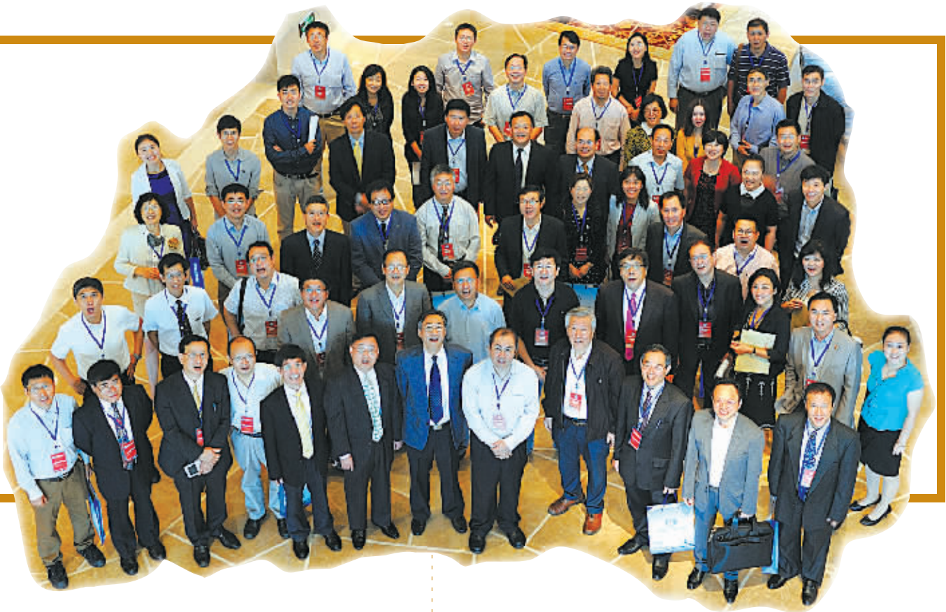
海智宁波之旅专家

从早期只关注人才、项目直接对接的市级活动，到如今国家级的集人才、科技、教育、产业以及社会中介机构为一体的人才开发综合品牌平台——“十年磨一剑”，宁波人才科技周完成了化茧成蝶的“蜕变”。