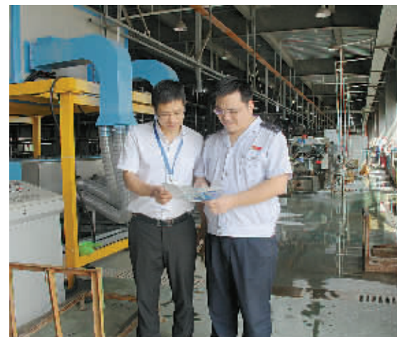
近日, 为确保“金税三期”征管系统顺利上线, 慈溪市国税局道林分局“税宣小分队”走进企业开展“出诊式”服务, 及时告知纳税人在新老系统切换期间应注意的相关事项。