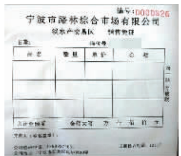
路林市场正规的销售凭证。

记者又随机走访了市场的6家批发摊位，其中5家的工作人员表示，前来进货的摊主一般不会索要销售凭证，而他们的“老板”也不曾开具销售凭证。如果有人“讨”，“老板”就会拿张白纸，写给他。