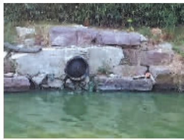
排污口已用盖状物堵住，暂时已没有污水排出了。