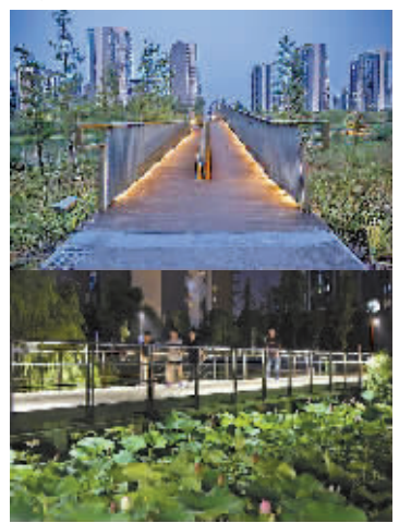
河面栈道和绿化步道上的灯亮了。（廖业强 摄）

18时30分，周围所有的照明设施同时亮了，生态长廊瞬间多了白色和黄色的光带，从长廊高处看下去，真美。（廖业强 摄）