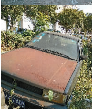
看经路上的僵尸车。