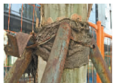
树干的“紧箍咒”已经解开了。（钟海雄 摄）

上周，记者在河清路的南北道路上看到，这些树木的“紧箍咒”已全部被解开，固定的铁架环内还细心地用布进行了包裹。（钟海雄 摄）