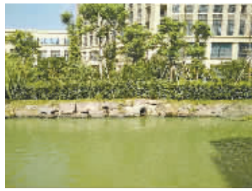
后西河一侧的堤岸上，有一个偌大的排污口。

江东区域管局一位工作人员说：这个排水口按照原先的设计是雨水管道，但是现在从里面排出了污水，有可能是被人截断了，具体原因目前还不清楚。他们会进一步调查，一旦查实，将对违法的单位进行严肃处理。