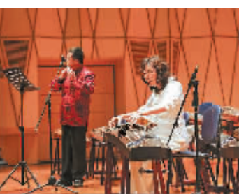
图为演出现场。

会,她演奏的浙派经典曲目《高山流水》《梅花三弄》及《战台风》等,淋漓尽致地展现了箏特有的清丽、淡雅及透亮、圆润的音色,举重若轻的弹奏技巧、飘逸洒脱的风范令人瞩目。