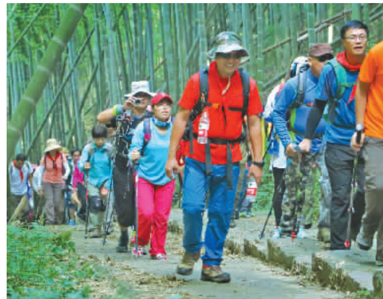
登山爱好者在登塔脑山。