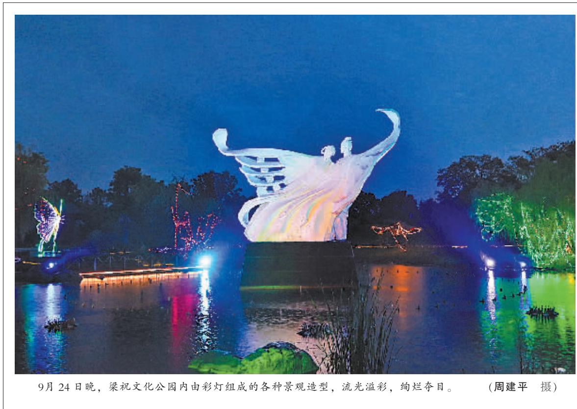
9月24日晚,梁祝文化公园内由彩灯组成的各种景观造型,流光溢彩,绚烂夺目。

随着国庆临近,宁波交响乐团“颂祖国”交响音乐会将于本月 27 日在宁波大剧院上演。