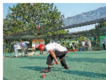
图为比赛现场。

本报讯(记者姬联锋)2016 年宁波市“思进杯”百队门球大赛暨“德丰利达杯”中国门球冠军赛分区赛宁波站比赛 9 月 24 日在中山广场门球场落幕。来自宁波各县(市)区的近百支球队参加了本次比赛,参赛选手中年龄最大的 92 岁。最终,镇海区骆驼街道队、江东区东柳街道队、奉化市门球协会队获得前三名。