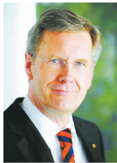
德国前总统武尔夫