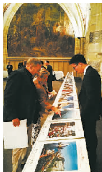
亚琛市民参观两地结好30周年图片展。

30年来，亚琛与宁波在经贸、教育、卫生、文化、人才培养、学术交流等领域开展了积极的交流与合作，民间交流和官方互访超过700次。《宁波日报》与《亚琛日报》作为姐妹媒体，近年来，双方新闻业务交流日益频繁，互相以图片和文字的形式反映两市的城市风貌，进一步增进两地人民的相互了解和友谊。（记者 冯璋）