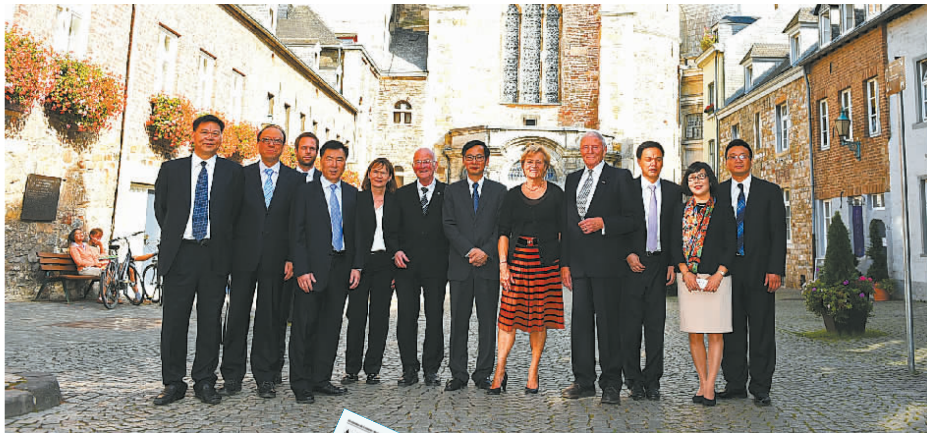
宁波市政府代表团参观亚琛市政大厅并合影。