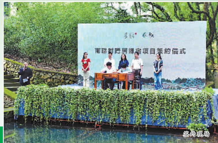
半浦古街