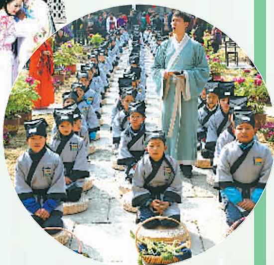
半浦小学国学礼仪