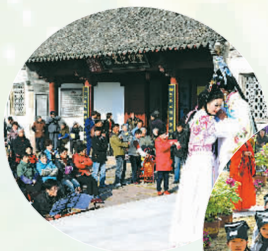
半浦慈孝礼仪进文化礼堂

依托古城浓厚的历史积淀、美丽的田园和山水资源，近年来，江北慈城通过开展“红色党旗引领绿色发展”行动，把散落在区域内的各处美丽资源实实在在整合起来。而这些资源，成为当前该镇推动乡村发展的新引擎、补齐农村发展短板的金钥匙。因为勾起了童年的记忆、淡淡的乡愁，这些开发出来的资源，越来越受到城市人的青睐。