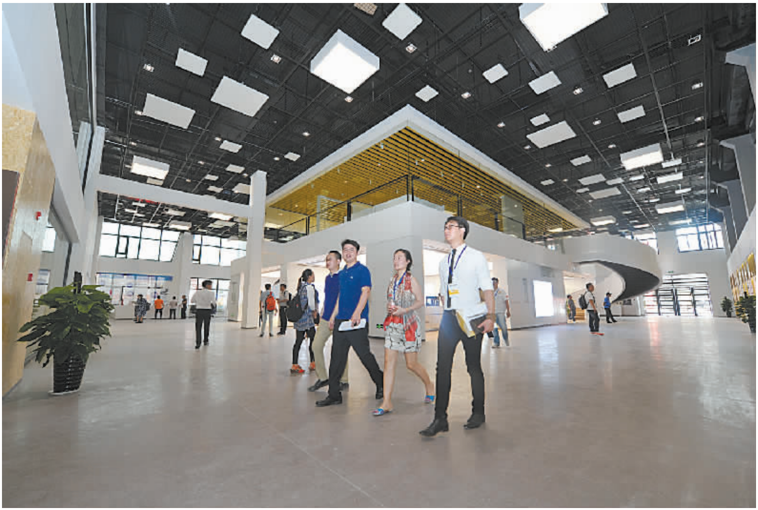
宁波杭州湾新区众创园。

去年12月以来，杭州湾新区先后出台促进电子商务健康快速发展、电子商务产业园认定办法、发展众创园推进大众创新创业的政策意见、补短板增优势加快国际化滨海名城建设的意见、全方位接轨上海三年行动计划等10多项产业政策。在众多政策叠加基础上，杭州湾新区将发挥全省环杭州湾地区创新平台优势，围绕产业链部署创新链，加强创新平台和创新创业园建设，坚持引进创新和自主创新，打造宁波创新资本最集中、创新要素最活跃的试验区；发挥汽车产业、家用电器等产业优势，围绕宁波首个“中国制造2025”试点示范城市建设内容，融入互联网、大数据、云计算等元素，对标工业4.0，提升智能制造水平，打造省内知名企业最多、产业特色最强的制造业集聚区，激发平台活力，构建长三角最优平台创新体系。