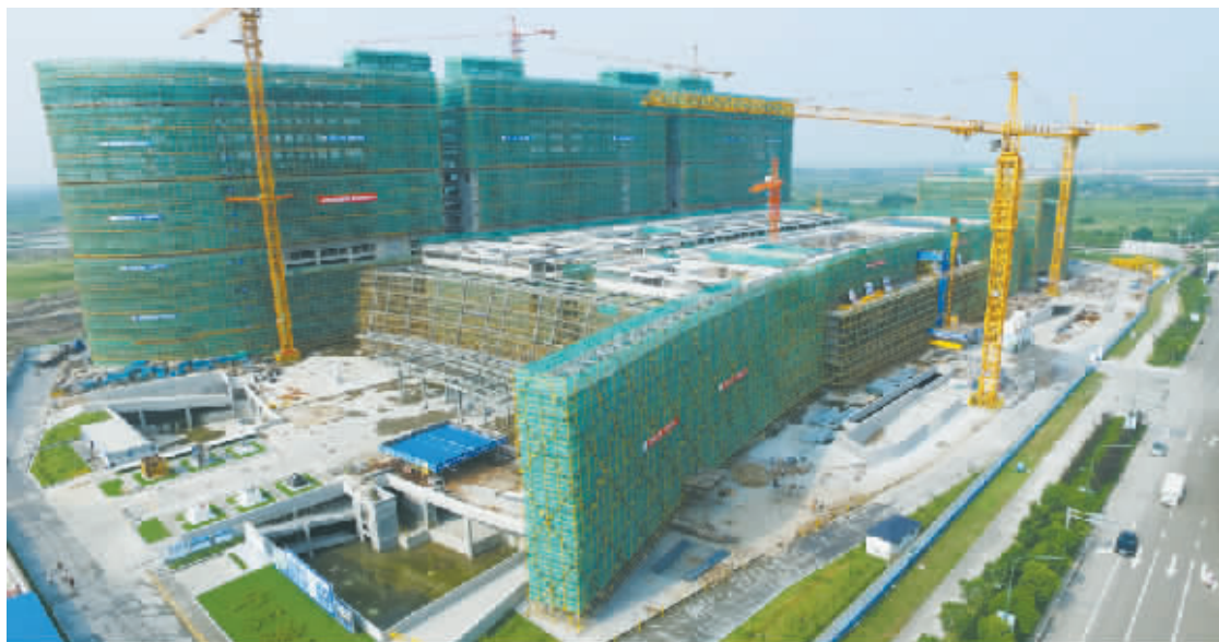
宁波市杭州湾医院。