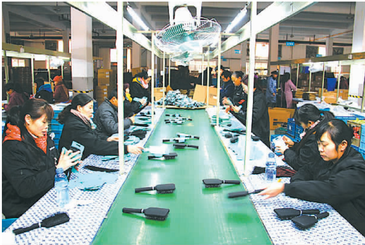
图为瑞孚集团梳子生产车间。