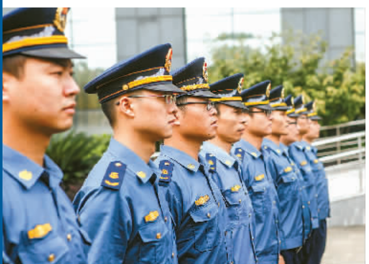
上图为运管工作人员执法现场。

“吃饭了,吃饭了!”午餐时间,高速公路保国寺出口,刚换下班的运管执法人员准备吃“饭”,照例,他们吃的还是方便面。