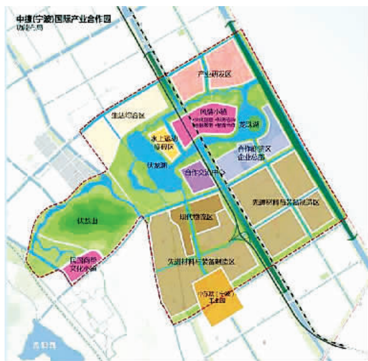
中捷(宁波)国际产业合作园功能布局

目前，中捷合作高端厨具制造中心、高新密封材料、捷克供应链保税仓、捷克水晶制品、中东欧农产品经贸合作平台等16个项目跟踪在谈并取得了积极成果。