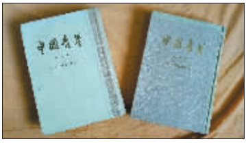
烈士卓恺泽 20 世纪 20 年代编辑的《中国青年》合辑