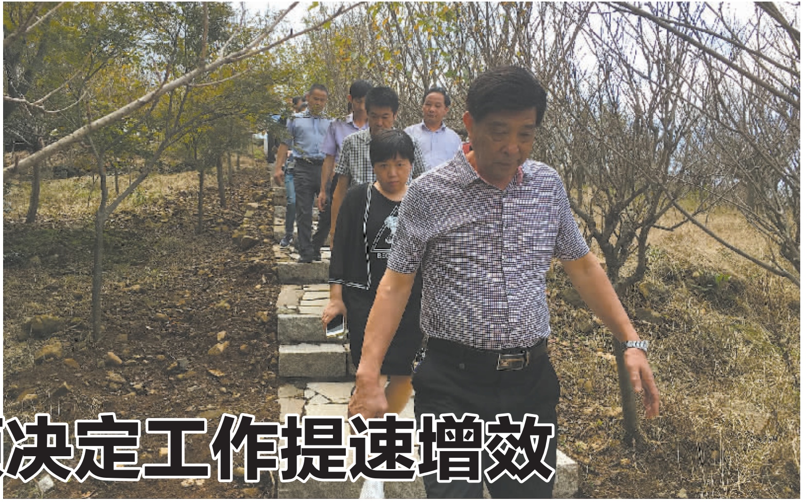
图为市人大常委会组织市人大代表视察四明山区生态保护工作。

近年来，宁波市人大常委会把推进重大事项决定权建设作为补齐人大工作短板、加强人大工作和建设、推动人大制度与时俱进的重要内容，在宪法和法律框架内，对重大事项决定权的行使进行了深入实践和持续探索，取得了积极成效。