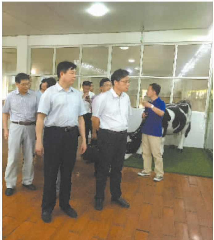
2016年7月19日，市人大常委会组织检查组在宁波牛奶集团开展食品安全专题视察。

为依法做实重大事项决定权，逐步缩小制度设计与实际功效的差距，市人大常委会贯彻省委“一线状态、一线作为”要求，着力补齐短板、强化履职，在广泛听取人大代表、基层群众、人大干部意见和系统总结历届工作实践的基础上，2013年正式把推进重大事项决定工作提上议事日程。