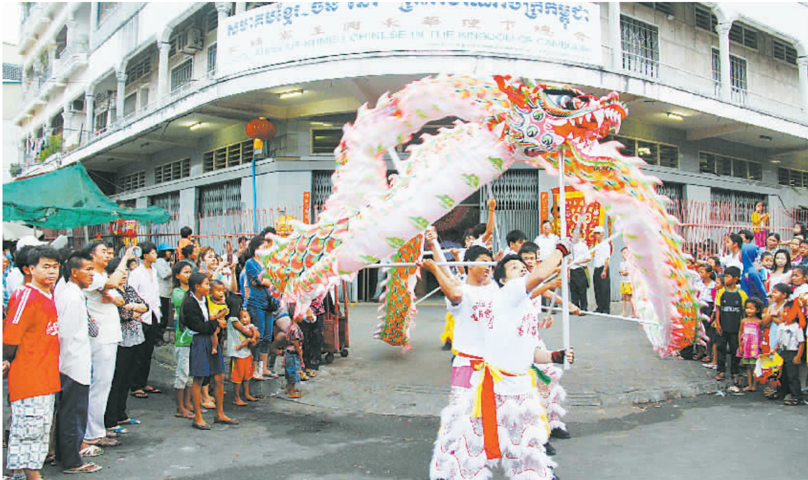
在柬埔寨首都金边，柬埔寨华侨华人社团的醒狮团在表演舞龙。

“柬埔寨、孟加拉国将成为宁波企业‘走出去’，推进国家‘一带一路’建设的新蓝海，一大波新商机在等待着甬企。”一直关注习主席出访的宁波市贸促会会长柴利达表示。