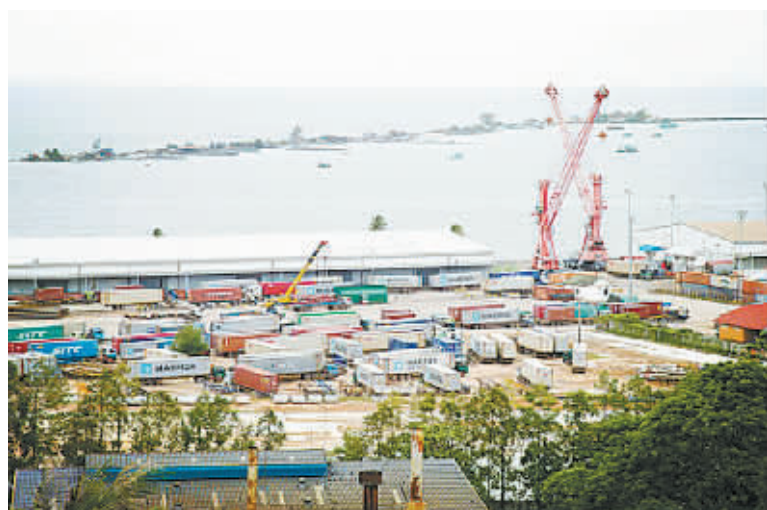
柬埔寨西哈努克港集装箱码头。