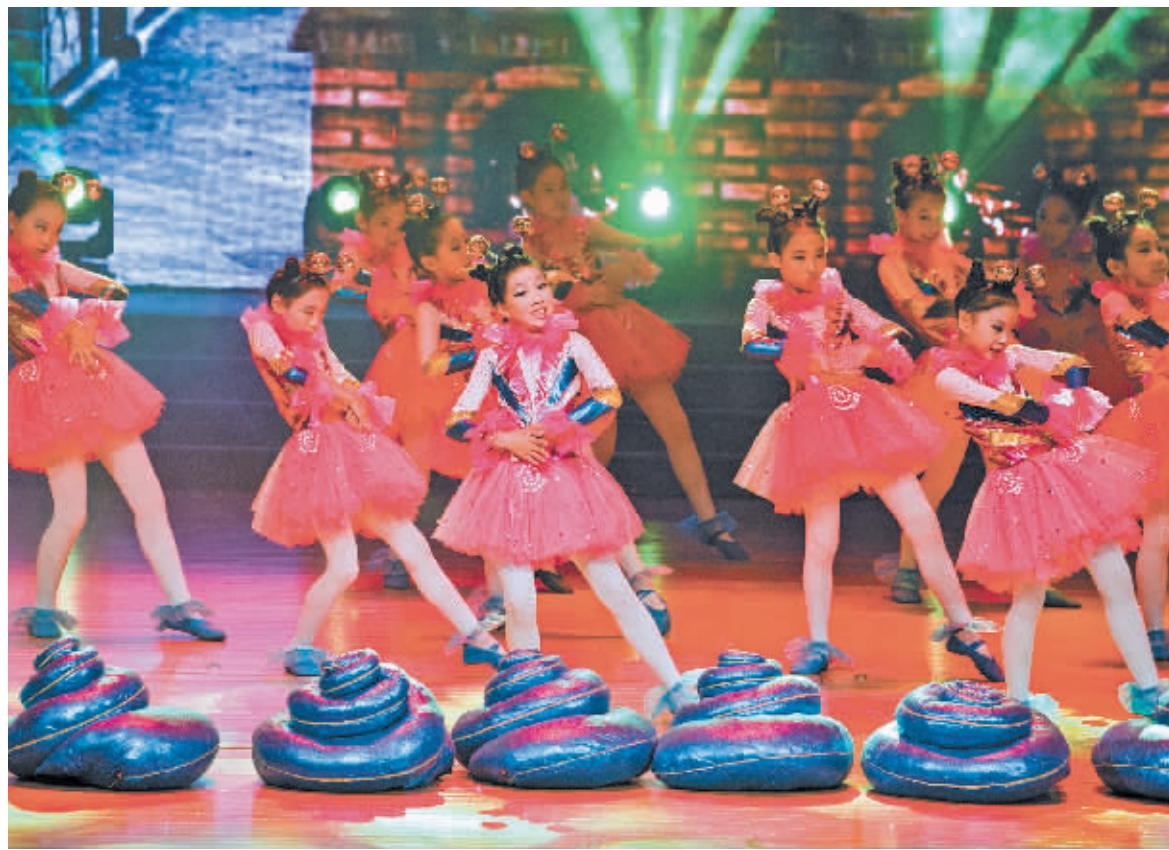
集士港镇中心小学的孩子们在表演《田螺姑娘舞蹈》。

昨天,集士港镇中心小学的《田螺姑娘舞蹈》、集士港镇明心文艺队的《田螺姑娘折子戏》、咸祥镇文艺队《阿拉柯鱼去》、古林镇宋王村《渔翁捉蚌》、余姚市四门镇文艺队的《木偶摔跤》等宁波市民间文艺舞蹈进行了展演。