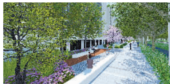
“塘河人家”效果图。

中山路综合整治项目景观提升工程的施工范围为中山路道路红线到沿线第一排建筑间的区域,内容包括铺装、景观小品、排水、土建及附属设施等,旨在有效整合道路景观资源,为市民提供休闲娱乐场所,全面提升中山路道路品质。 中山路景观提升工程延续中山路城市设计的基调,从全线的“塘河人家”“府城古韵”“繁华商埠”“未来城市”“宜居绿城”五个主题入手,针对每一个主题,设计相应的景观效果,使得景观铺装效果与路段主题相得益彰,将极大地改善中山路沿线景观设施效果,提高休闲舒适度,有效提升中山路的城市道路品质,成为一条“宁波人自豪、外地人称赞”的城市主轴。