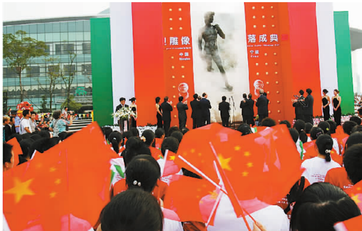
2006年10月21日，宁波举行大卫雕像落成典礼。

接着，我们在宁波大剧院会客厅商量施工、安装事宜，佛罗伦萨技术人员展开大卫雕像底座的图纸，与宁波有关施工、安装单位人员进行沟通。因宁波的夏秋季常有台风，对雕像抗风力要求较高。据了解，大卫雕像打桩深达24米，可抗24级以上台风。