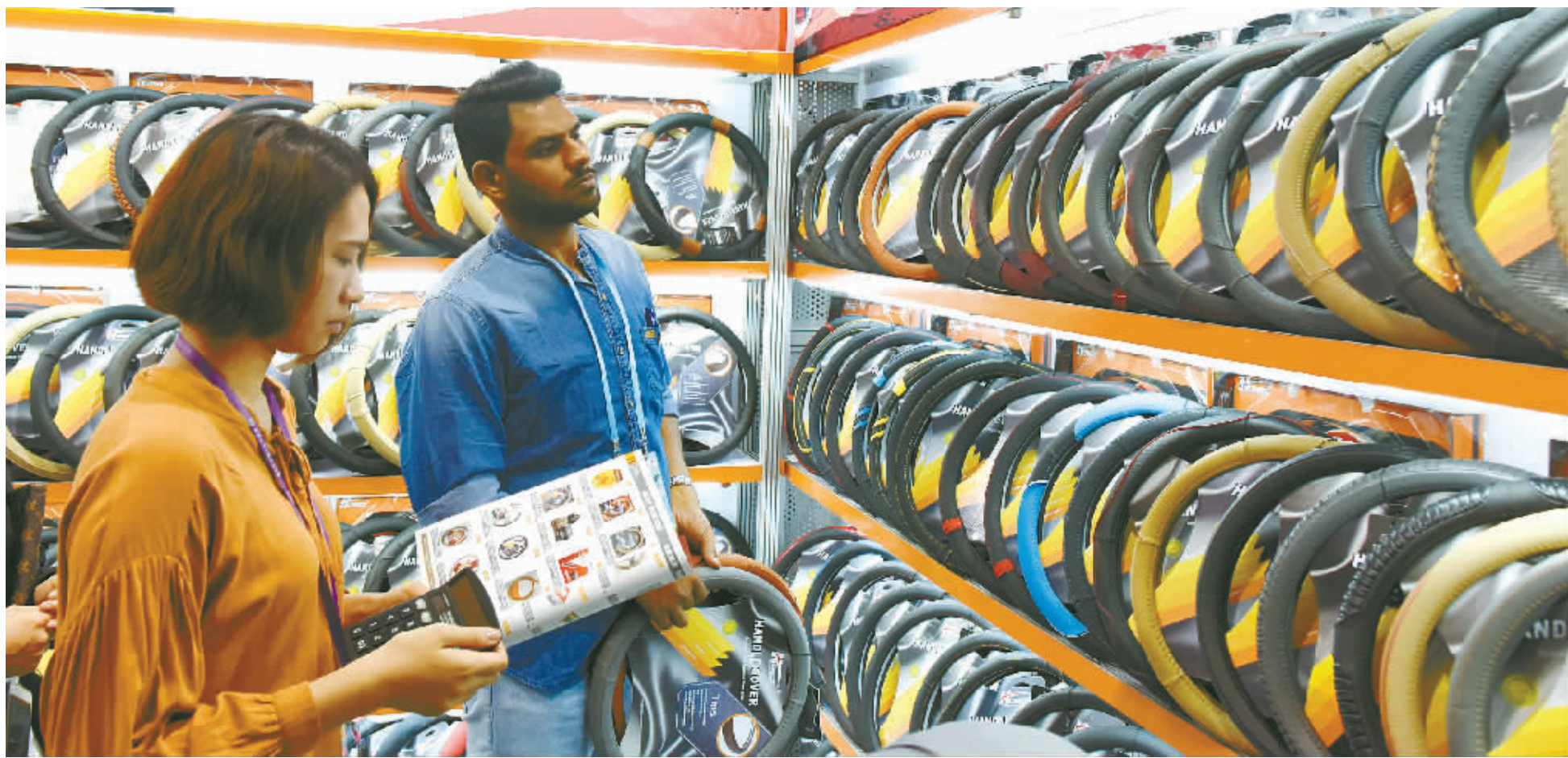
10月15日，客商在广交会展馆内选购汽车配件。