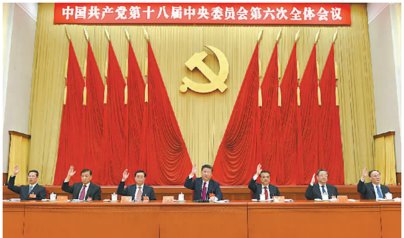
习近平、李克强、张德江、俞正声、刘云山、王岐山、张高丽在主席台上。