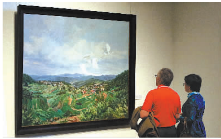
市民在宁波美术馆观赏俄罗斯列宾美院油画。

本报讯(记者陈青 通讯员徐良)“港口与人类理想——俄罗斯列宾美院油画精品展”昨日在宁波美术馆开展,共展出列宾美术学院A·K·贝斯特洛夫、叶甫盖尼·祝波夫、谢尔盖·宾、安德列·丘古诺夫