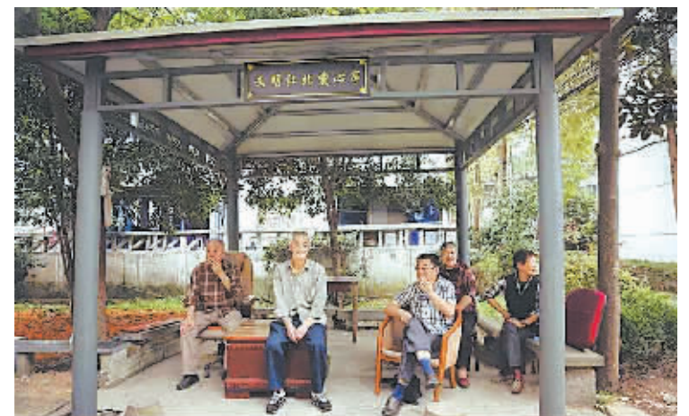
新建的“文明江北爱心亭”。

本报讯(记者徐欣 江北记者站张雁雁 通讯员沈旦)“这些遮阳棚虽然方便了部分居民的日常休闲,但随意搭建,破坏了小区内的原有风景,而且它不符合小区的建设规范和文明城市创建要求。”社区工作人员告诉记者。