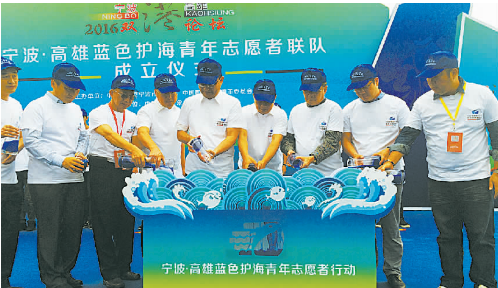
宁波·高雄蓝色护海青年志愿者行动启动仪式。