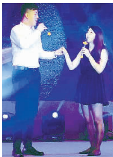
两岸青年深情对唱《你最珍贵》。