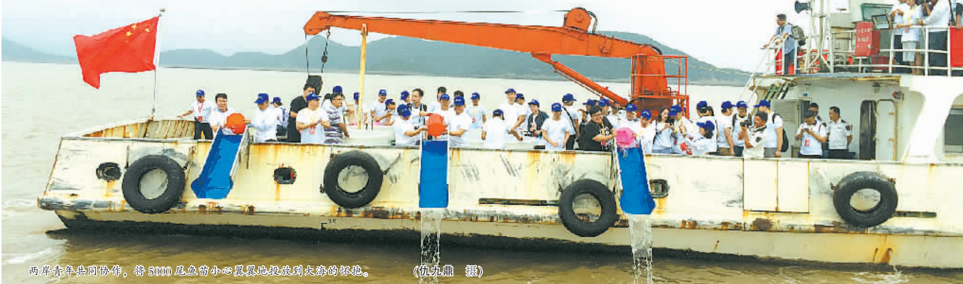
两岸青年共同协作，将5000尾鱼苗小心翼翼地投放到大海的怀抱。

甬台渔民“同捕一片海”，一条石斑鱼更见证了两地的渔业合作。位于高塘岛的海峡两岸石斑鱼产业化合作（象山）示范基地项目是“浙江象山海峡两岸渔