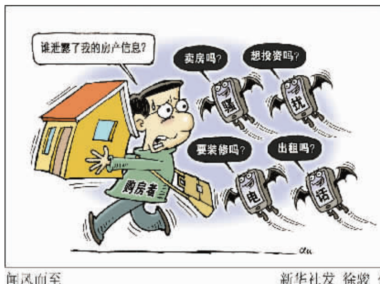
闻风而至 新华社发 徐骏 作

近年来，各类手机骚扰信息令百姓不胜其烦，其中数量最多的包括卖房、装修和房贷等信息，对于公民个人房产信息的非法泄露、售卖、使用，已形成一条地下产业链。警方认为，房地产公司、物业公司等对房产信息泄露难辞其咎。但是在实际中，一些员工为利益泄露业主信息，只能被视为个人行为，很难追究公司责任。应加大房产信息泄露的源头监管，加强对房地产公司、物业公司等失责的监管、处罚力度。