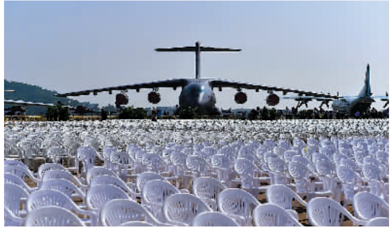
10月31日，我国自主研发的首款大型运输机——运-20静卧在航展静态展示区。

据新华社珠海10月31日电（记者陈芳 胡喆 马晓澄）在明日开幕的第十一届中国国际航空航天博览会（即“珠海航展”）上，中国自主研发的新一代隐身战斗机首次