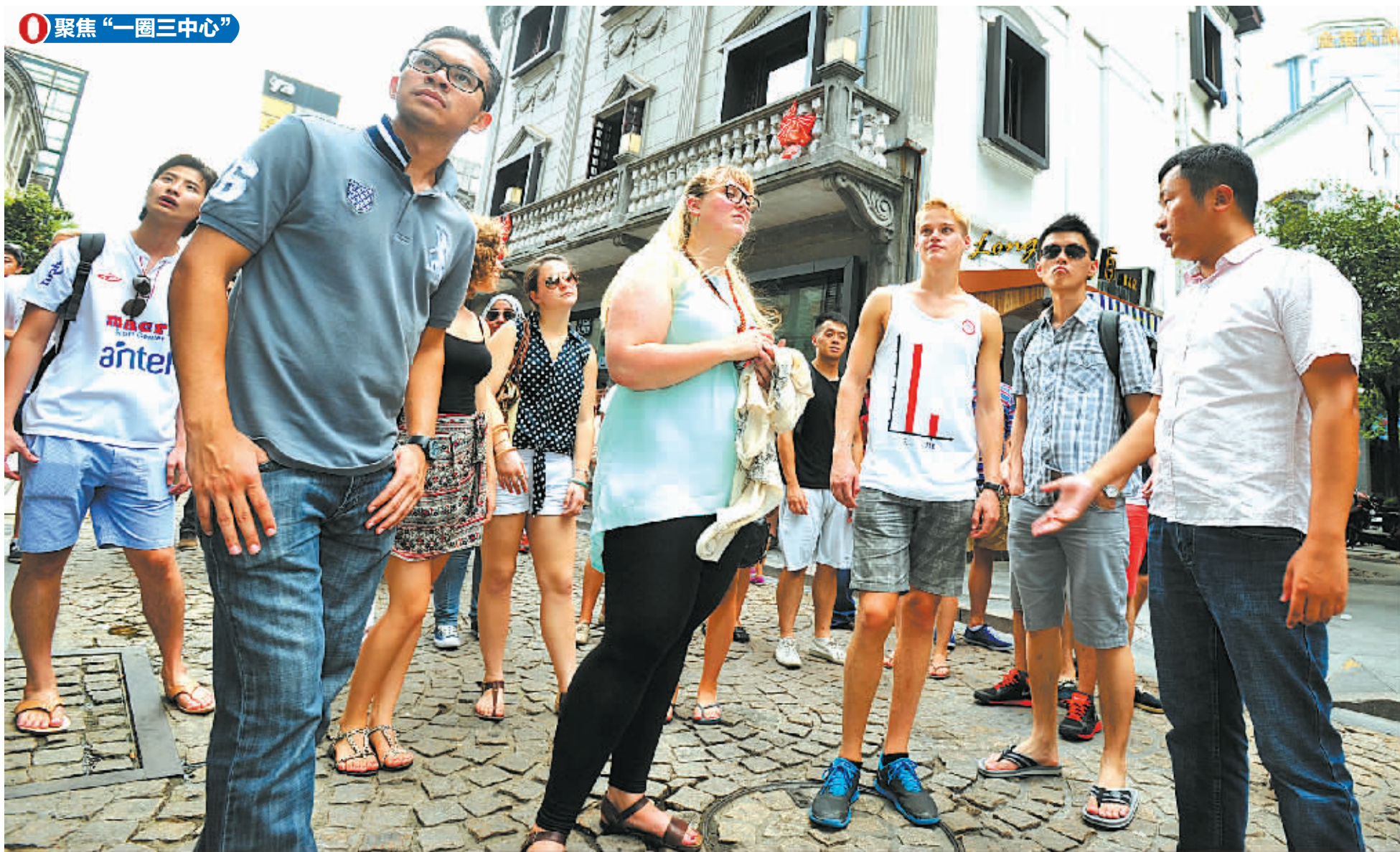
国外游客在游览宁波老外滩。