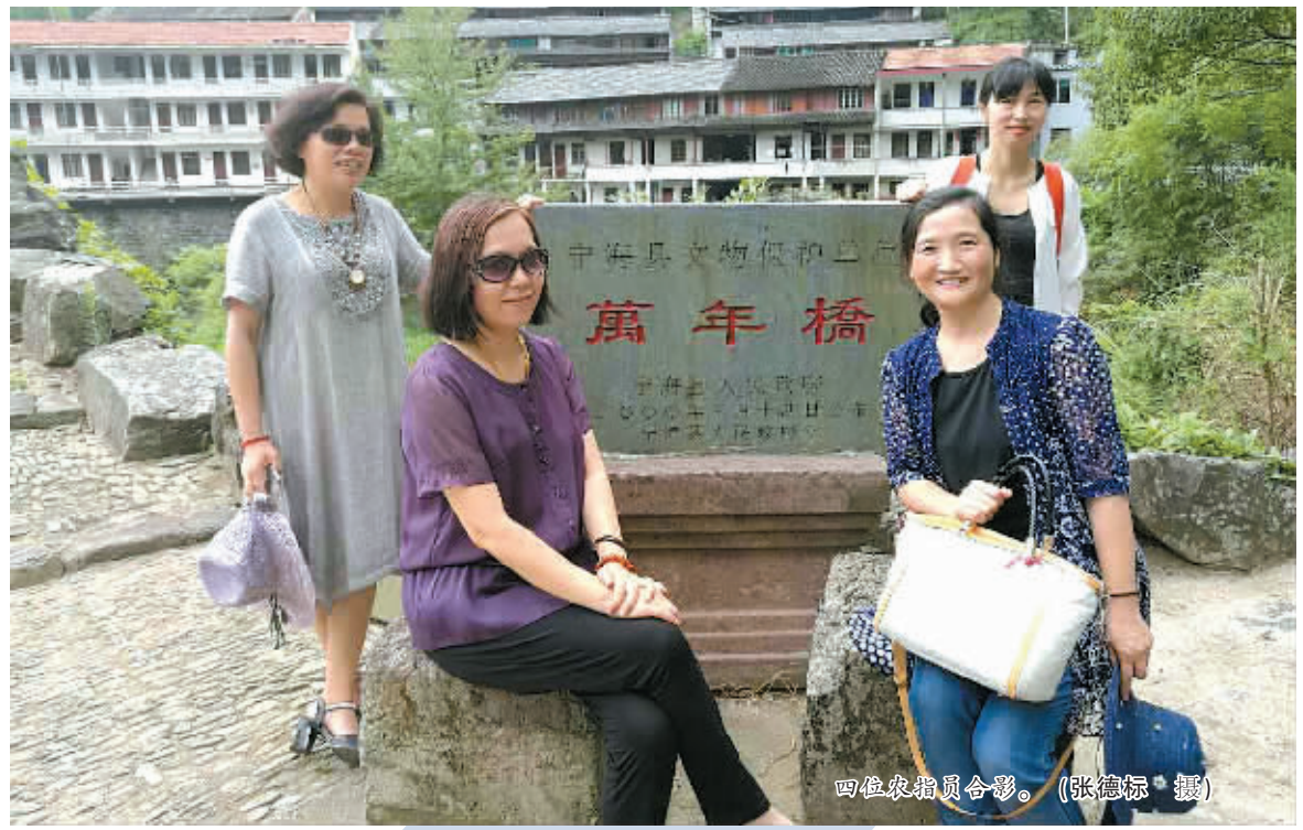
四位农指导员合影。

女农指导员虽然只占全市农指员的少数,但发挥的作用却不小。她们克服山高路远条件差等困难,以独特的情感融入村民中,从小事做起,一点一滴地整治环境卫生,一点一点地帮助低收入农户增收,为村民做实实在在的事,深受镇村干部群众欢迎。