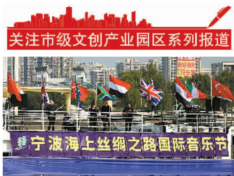
图为2016宁波海上丝绸之路国际音乐节启动仪式现场。

本报讯(记者崔小明 江北记者站张落雁)昨天,海上丝绸之路国际音乐节在宁波音乐港启航。今年年初以来,宁波音乐港文化创意产业园区大力发展音乐文化,北大青鸟等知名企业先后落户,成功举办第三届浙江省合唱节。经过规划论证,宁波音乐港文化创意产业园区“一核”“一园”“多边”的功