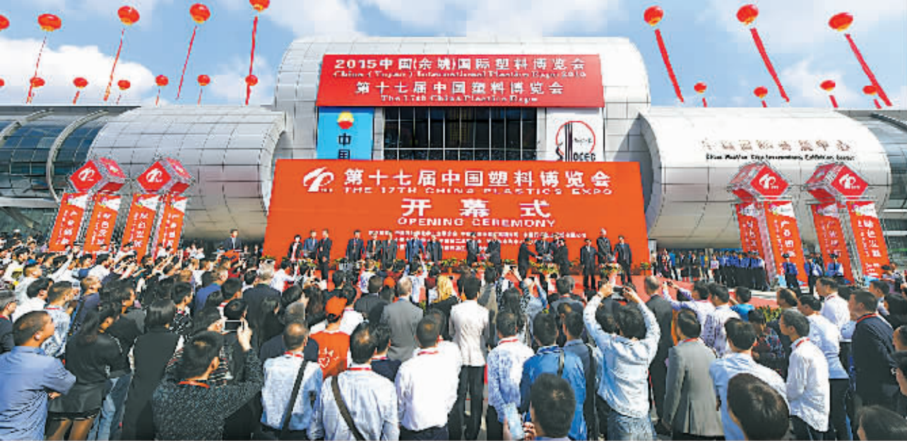
第十七届中国塑料博览会开幕式现场。

让人期待的是,本届塑博会在推进展会市场化需求导向、提升展会品牌影响力、发挥行业协会资源优势和增强论坛国际化程度和推动展会招商引资平台建设等方面又做了进一步的努力,有了全面提升。