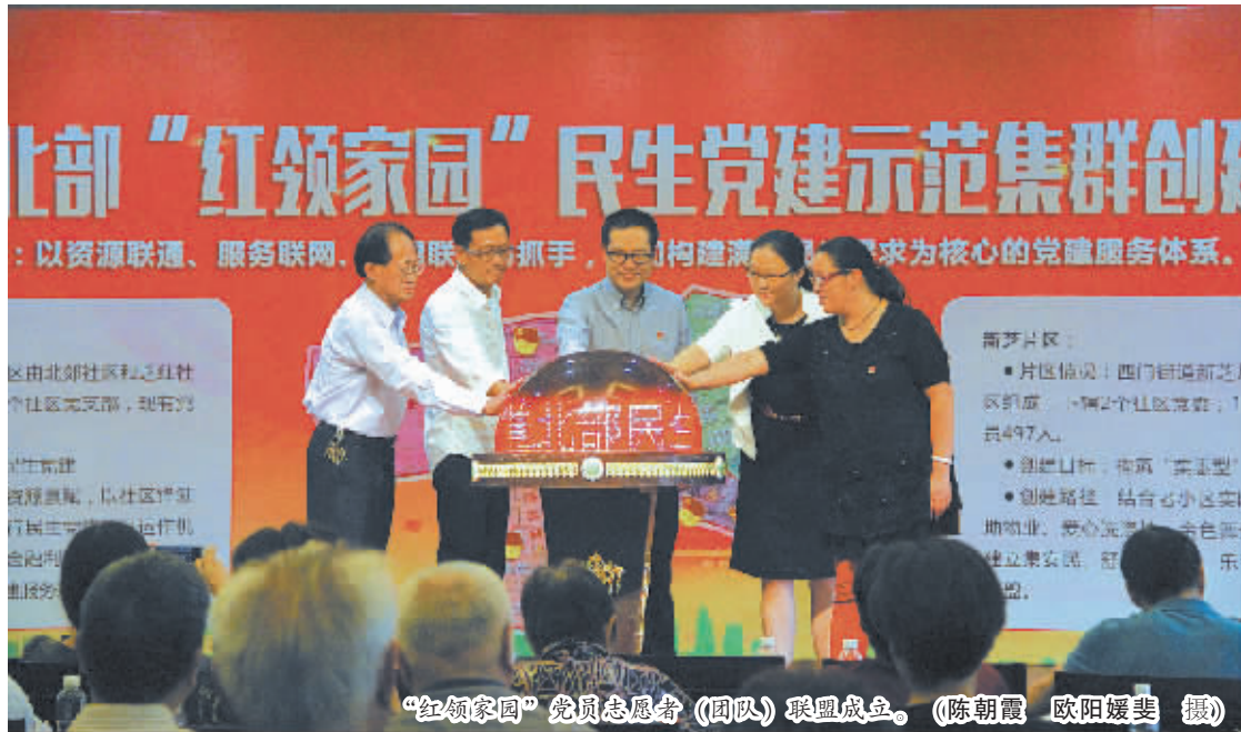
“红领家园”党员志愿者(团队)联盟成立。

今年3月,海曙区西门街道综合考量辖区地缘人文、服务需求和发展实际,有效整合和发挥现有各片区的服务资源和服务型党建共建优势,启动创建北部“红领家园”民生党建示范集群。“集群形成北郊与芝红结对的‘活力型民生党建示范群’和新芝与永丰结对的‘实惠型民生党建示范群’,其中北郊、新芝是区级五星级社区,芝红、永丰是区级四星级社区,这样的集群能发挥以强带新的效能。”西门街道相关负责人告诉笔者,集群克服了小网格受地域和资源限制引起的服务资源不均衡、服务居民不全面的缺点,半年来发挥了党建惠民最大“效益”,居民也有更多的获得感。