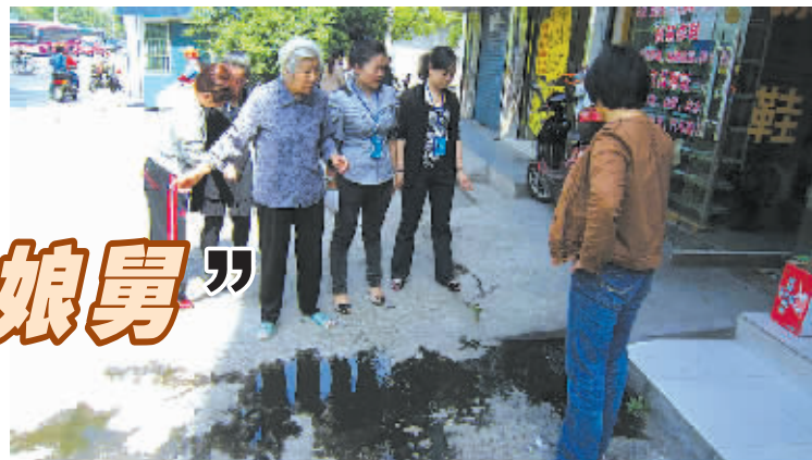
居民投诉有店铺“门前三包”不规范,“午间调解庭”第一时间到现场查看。

仅影响环境美观,还存在一定的安全隐患。这一“老生常谈”的难题,被“午间调解庭”解决得漂漂亮亮。