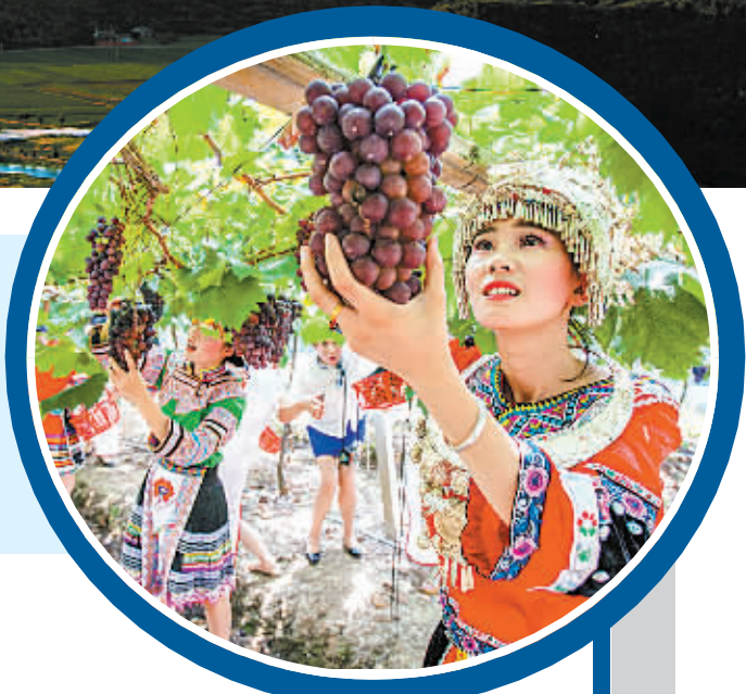
晓塘乡葡萄节

象山美丽景致更与美丽经济相结合，加快产业转型升级，2015年农业总产值达到114