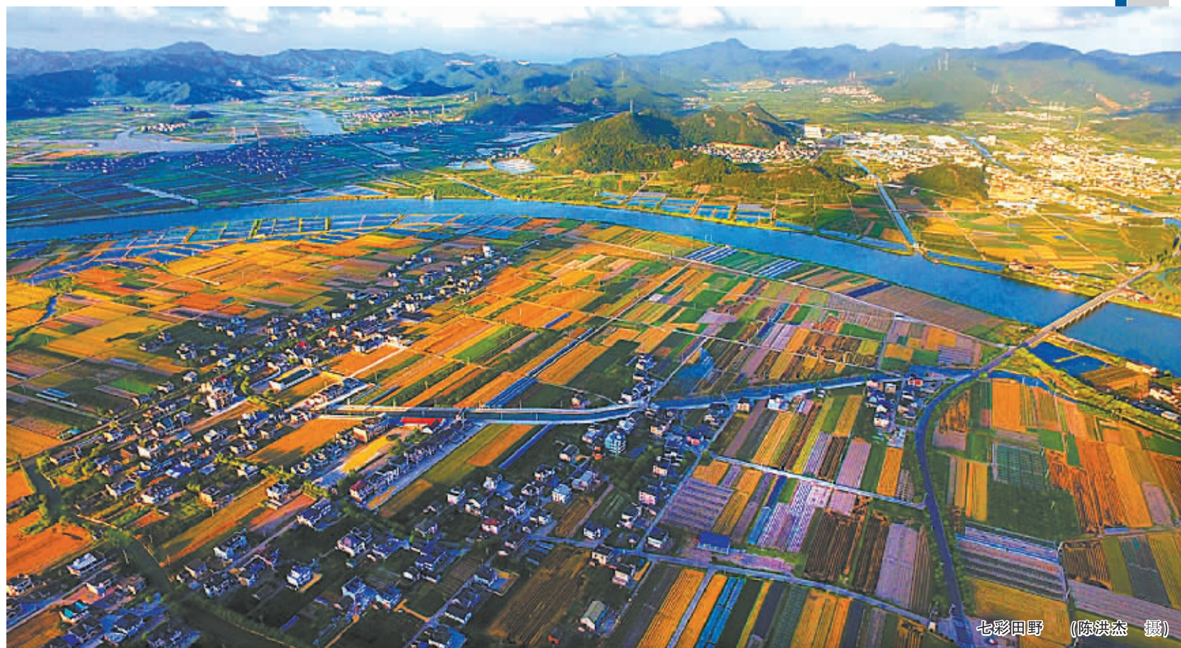
七彩田野