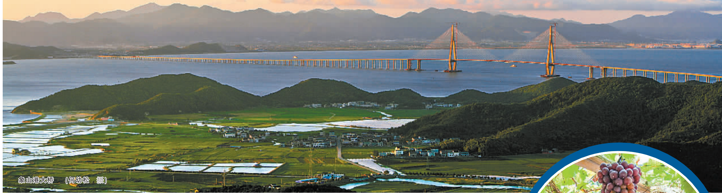
象山港大桥

近日，省委、省政府通报表彰首批“浙江省美丽乡村示范县”，全省共6个县（市）获此殊荣，象山县成功入选，成为我市唯一入选县（市）区。同时，该县茅洋乡、定塘镇入围省首批美丽乡村示范乡镇。