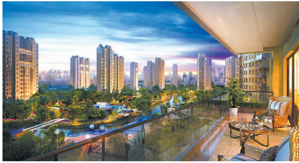
龙湖经典项目效果图。