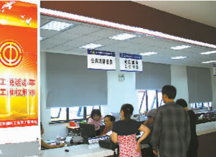
群众在窗口享受便捷的公共法律服务。

人民调解经验全国推广。2015年3月27日,市人大常委会审议通过《宁波市人民调解条例》,宁波成为在《人民调解法》实施后,全国第二个、全省第一个以地方性法规形式规范和发展人民调解工作的地级市。全市已建各级人民调解委员会4087个,实现村(居)人民调解全覆盖。已建成行业性、专业性人民调解组织113个,其中医疗纠纷人民调解工作被誉为“宁波解法”,在全国推广。全市各级医调委成立以来,累计受理医疗纠纷5318起,调解成功率为98.6%。2015年4月,中央政法委、司法部等领导到市医调委实地考察,予以高度肯定。