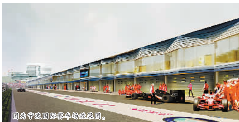
图为宁波国际赛车场效果图。

们关注的重点。“我们正在创造一个新的历史。”国际汽联、国际摩联的专家一致表示,这条全球前所未有的双赛道将带给观众超乎预期的观赛体验。