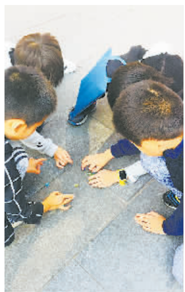
图为海曙区外国语学校的小男生正在体验“打弹子”的乐趣。