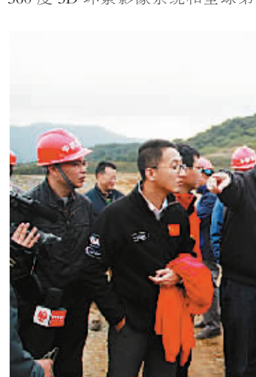
国际汽联(FIA)和国际摩联(FIM)联合现场验收。

春晓的“底气”同样令人佩服,仅仅数年间,曾经的穷乡僻壤,摇身一变成为汽车之城。春晓集中吉利、敏实、拓普、佛吉亚、东汽等国内外知名汽车整车及零部件制造商,汽车全产业链集聚效应越来越明显。吉利汽车一直是春晓工业经济的“领头羊”。目前整车装配速度已从原先180秒/车降到130秒/车,产能提升38.3%。敏实集团在8月份推出一款新型汽车智能摄像系统,成为目前全球最小的360度3D环景影像系统和全球第