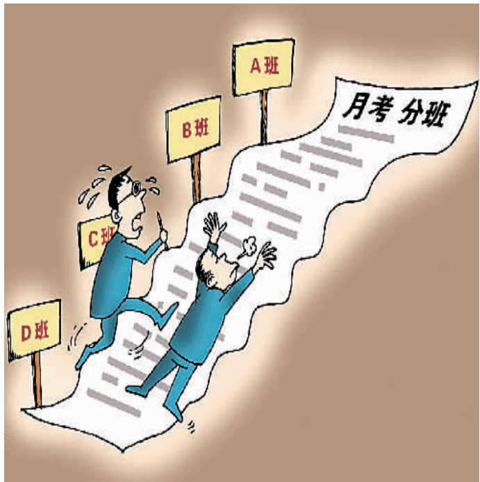
据11月20日《华商报》报道：“这次月考完根据成绩重新分班，已经到新班上上课了，以后每次月考完都要分班。分到差班的学生有的哭了，也没有心情写作业。”西安市西电中学初三学生反映，该校根据成绩分班，学生感觉很折腾。该校一名负责老师回应：“这是分层教育，请大家理解。” 升学压力不一般，哪堪月月再分班。学生哭来家长怨，分层教育真打脸。 分数歧视上演，教书育人全跑偏。有教无类传千年，说说容易行真难。 郑晓华 文 高晓建 绘