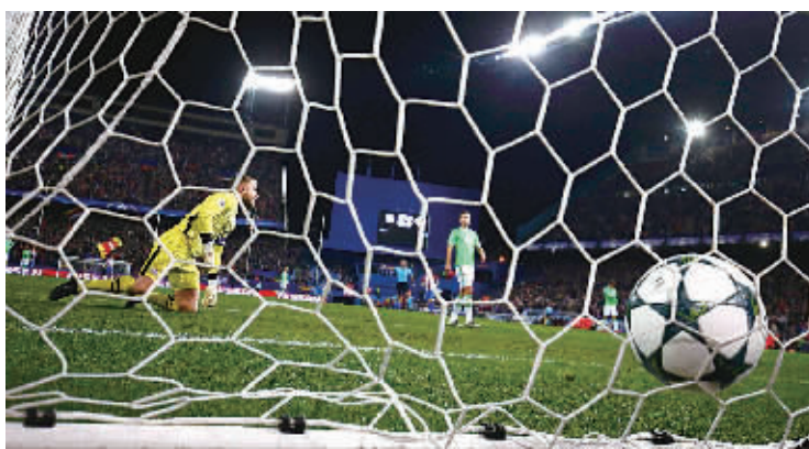
马竞队球员加梅罗进球瞬间。

除了16强的争夺，本赛季小组第一的竞争局势也颇为微妙。在以往的欧冠比赛中，小组第一大多意味着能在首轮淘汰赛中抽到一个不错的签位，但由于今年多个小组出现强队两两“扎堆”的情况，因此，即便锁定小组头名，可依旧有不小的概率在1/8决赛中遇上一个实力强劲的小组第二。