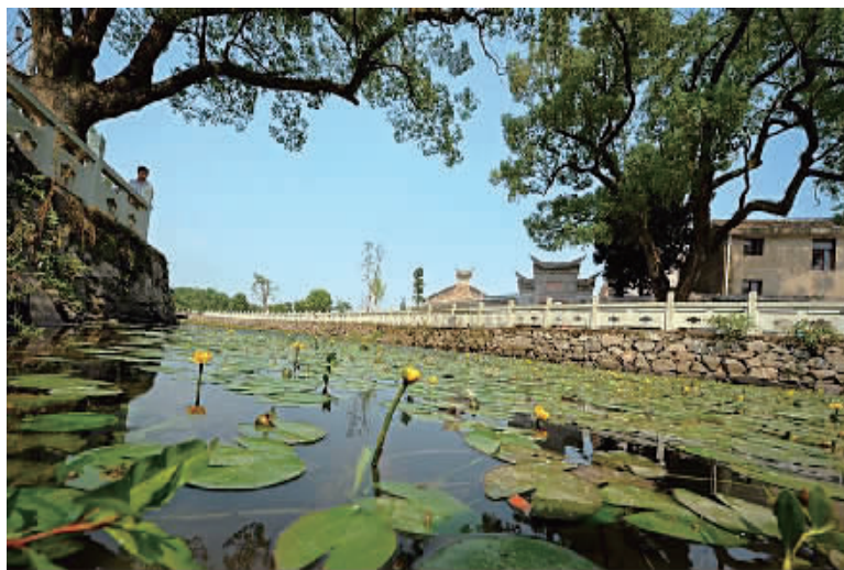
绕村流淌的枫湖。

不仅如此,舌尖上的湖头村也令人回味无穷。如麦饼制作,是当地的一项传统技艺,几乎家家户户做得一手好麦饼,麦饼更是湖头村人的主食之一。笔者还走访了村里一家祖传制作“状元糕”的小铺:雪白的米粉夹上黄糖,在蒸锅上一蒸,不一会儿就米香四溢,香糯可口的糕点便出炉了。“村里喜事都少不了‘状元糕’,现在慕名而来尝鲜的游客也越来