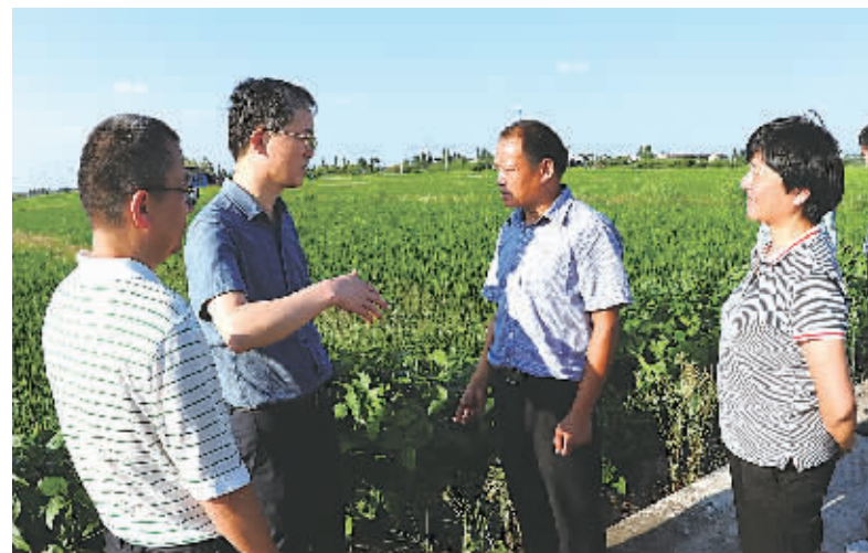
宁波银监局相关负责人在农行宁波分行领导的陪同下,赴奉化市西坞镇,调研农行扶持现代新型农民的探索路径。

随着农村经济发展和消费升级,农村资金流动越来越大,农民的金融需求也日益增多。但受制于银行物理网点数量有限,区域分布集中等原因,农村地区普遍存在着享受金融服务难、获取金融知识难和金融维权难等现实问题。农行宁波分行重点实施“金穗惠农通”工程,在监管部门的大力支持下,农行服务网络不断向广大农村地区延伸,农村基