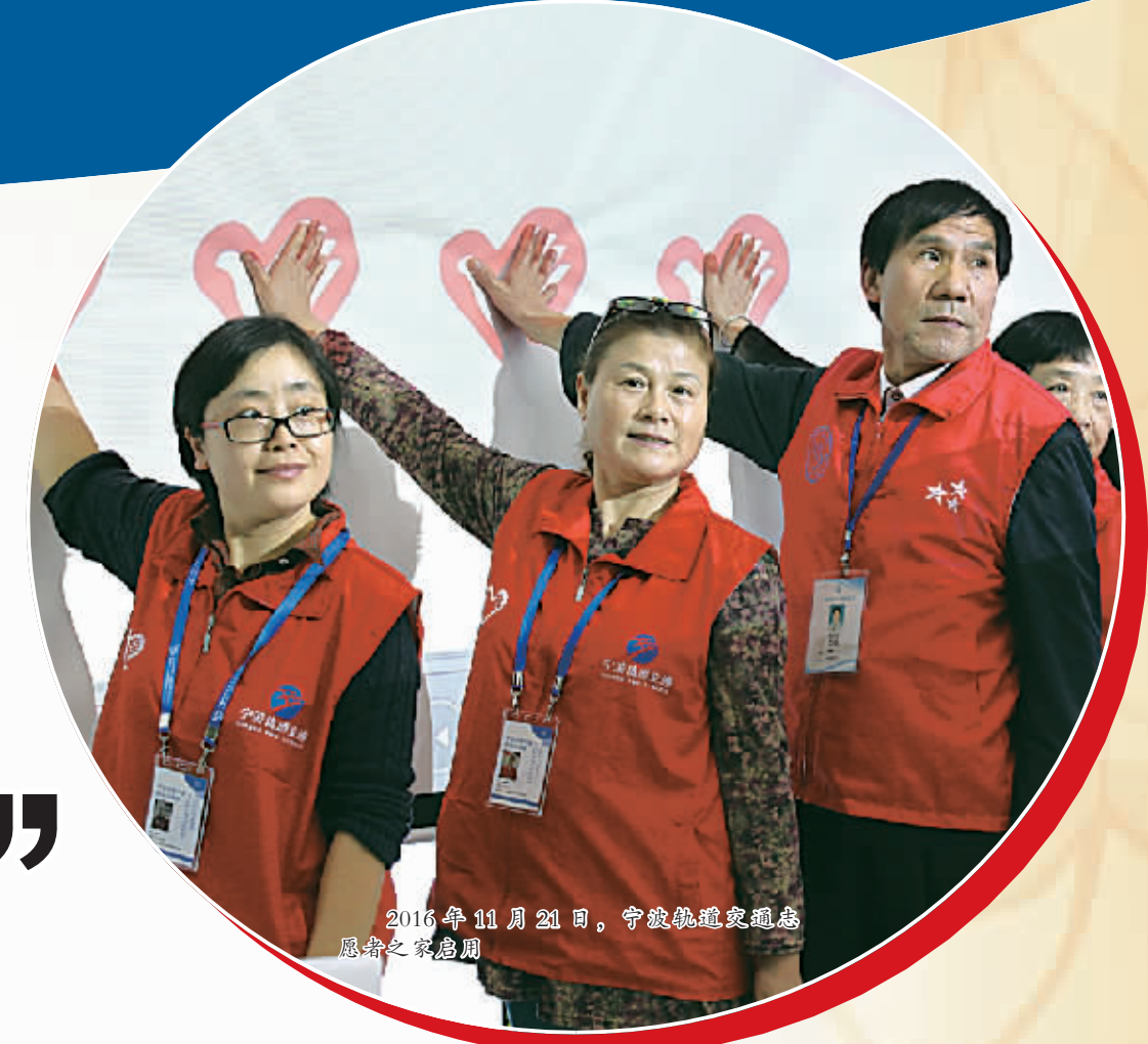
2016年11月21日，宁波轨道交通志愿服务总队之“铁丝”