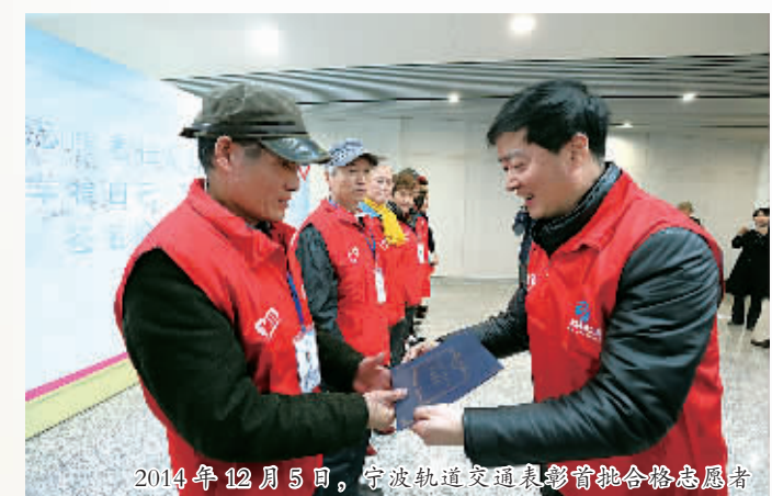
2016年12月8日，宁波轨道交通志愿服务总队合影