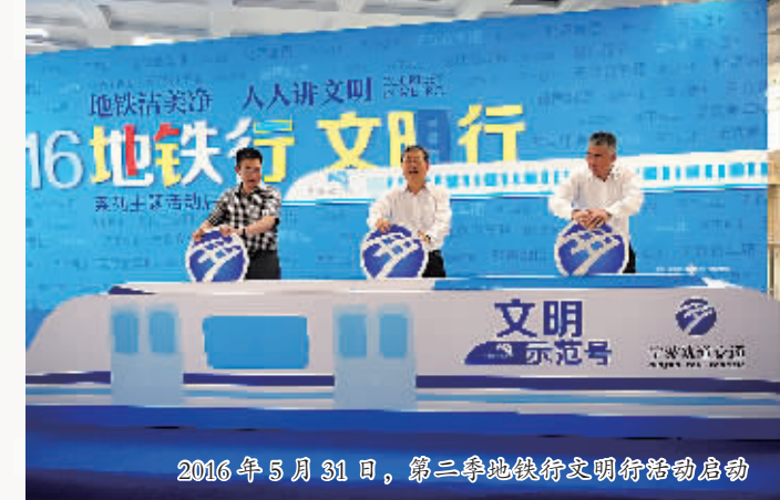
2016年5月31日，第二届地铁文明行启动仪式