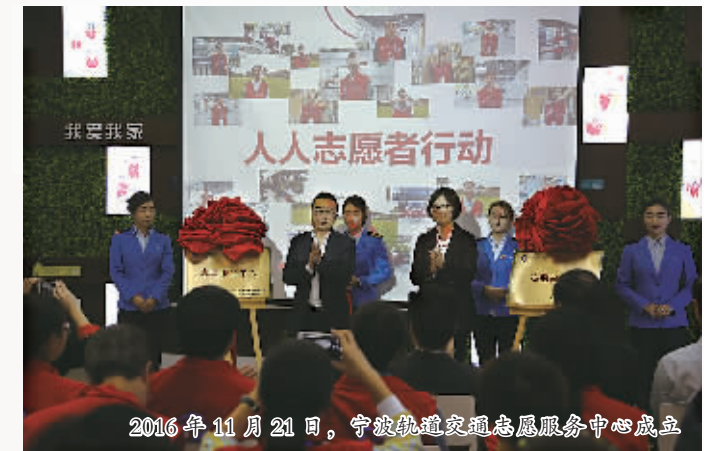
2016年11月21日，宁波轨道交通志愿服务总队成立