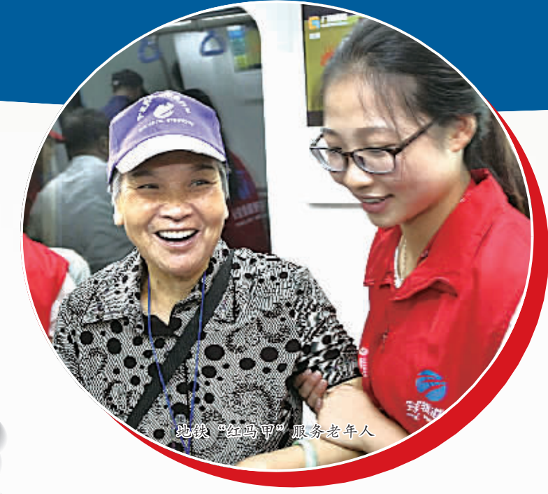
地铁“红马甲”服务老年人