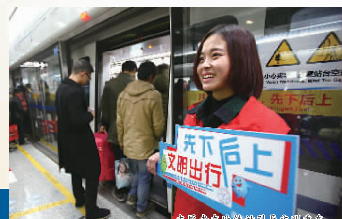
志愿者在地铁站引导文明乘车