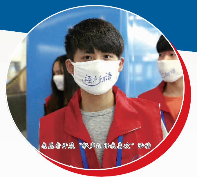
志愿者开展“轻声的礼貌喜欢”活动