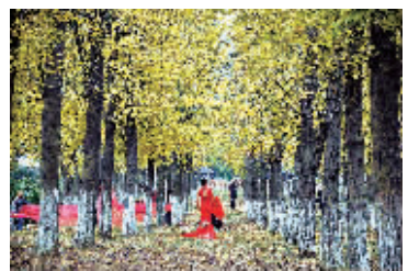
暖冬的东钱湖畔,风光美好吸引新人们纷纷前往拍摄婚纱照,留下美好的瞬间。图为昨日,在环湖南路银杏林中,一对对新人在这定格美好瞬间,成为暖冬一道靓丽的风景线。