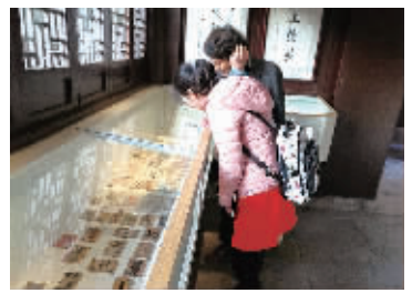
12月2日,宁波鱼文化博物馆举行为期一月的“纸币、火花、邮票”联展,共展出百余件各个国家、多种风格、充满异域风光的精美钱币、火花、邮票。图为展览现场。

本的高度关注。文化传媒产业细分领域的工业化,将是未来投资的“蓝海”,文化产业工业化进程的程度有多深,投资价值就会有多大。本土企业家欧琳集团董事长徐剑光作了题为《让制造业更有温度》的演讲。徐剑光认为,互联网时代,中国的制造业将面临着一场别无选择的变革,制造业要向中高级阶段发展的话,一定要用好文化、互联网这两个工具。陈少峰作了《文化电商与消费制造业升级》的演讲。陈少峰认为,现在传统的企业,除了自己的产品转型,还要懂互联网新技术,此外,还要有新的思路和方法,充分利用互联网的技术手段,进行创业辅导,导入创业资源。制造业转型升级,光靠产品的设计是不够的,还要有品牌号召力。