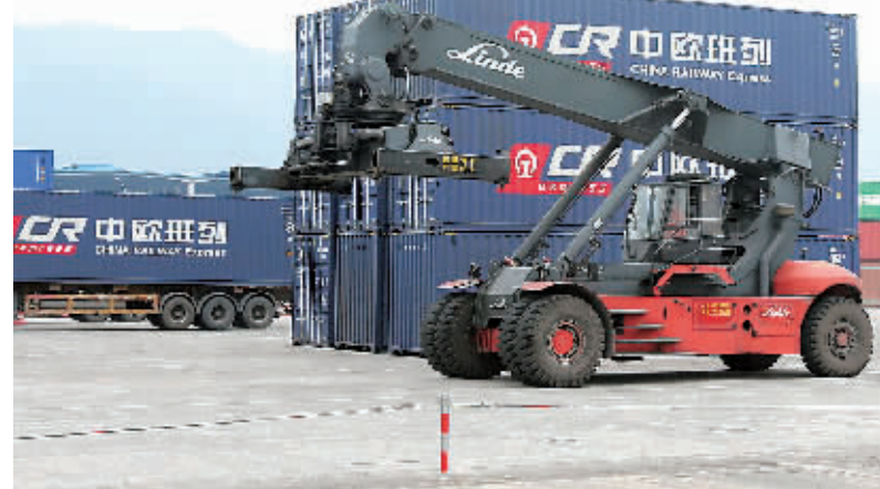
重庆外贸崛起的背后，正是大力推进开放大通道、大平台、大通关、大产业和大环境建设，促进开放型经济发展的一系列举措落地开花。图为重庆“渝新欧”铁路口岸。

专家认为，宁波要依托长江经济带腹地经济和消费优势，打造成为中国与中东欧合作的示范城市，为长江经济带沿线城市提供更多贸易机会。“宁波搭建的是中国与中东欧国家合作的大平台，中东欧国家可以以宁波为支点，拓展至全中国。”11月5日，在拉脱维亚首都