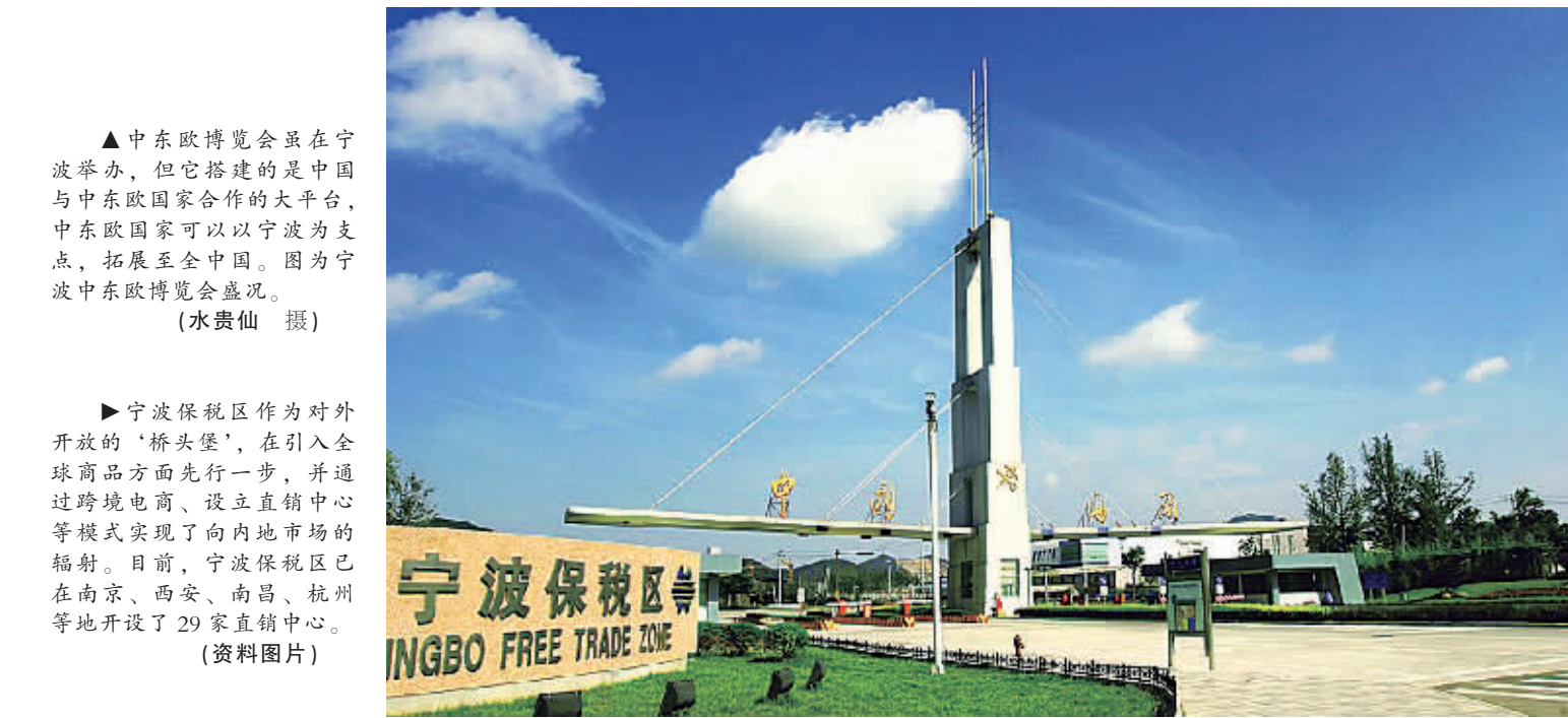
▲中东欧博览会虽在宁波举办，但它搭建的是中国与中东欧国家合作的大平台，中东欧国家可以以宁波为支点，拓展至全中国。图为宁波中东欧博览会现场。

►宁波保税区作为对外开放的“桥头堡”，在引入全球商品方面先行一步，并通过跨境电商、设立直销中心等模式实现了向内地市场的辐射。目前，宁波保税区已在南京、西安、南昌、杭州等地开设了29家直销中心，2015年销售额达2亿元。