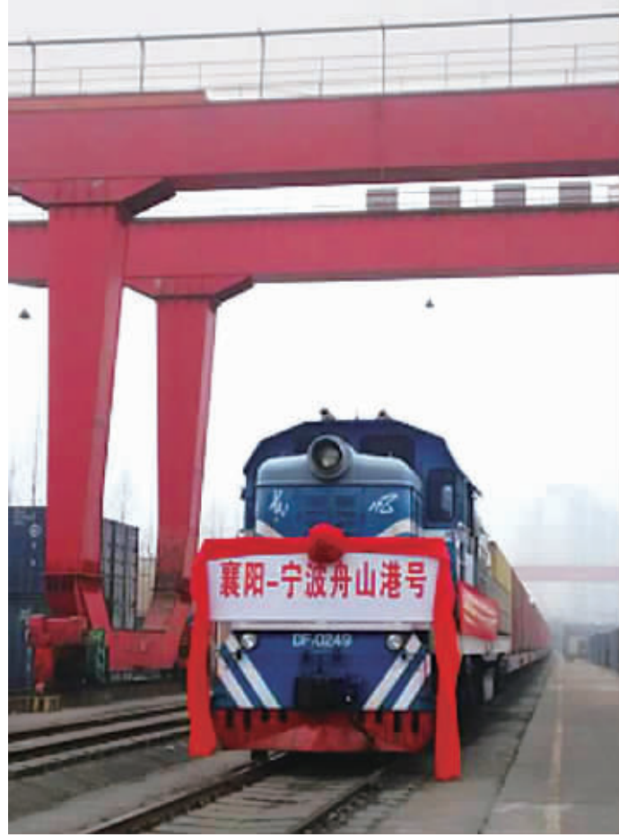
“襄阳—宁波舟山港”列车全程50个小时，抵达后货物直接装船发往全球各地。(资料图片)

如果说上一轮的产业转移主要是以全球500强为代表的全球产业链布局，这一轮的产业转移则更多是各类专业领域的隐形冠军，在中国市场发展成熟后“走进市场”的选择。尽快建设国际产业合作园这类有针对性的平台，精准地吸纳和集聚特定行业，是在为国际价值链分工、产业分工中谋得更有利的地位打下基础。