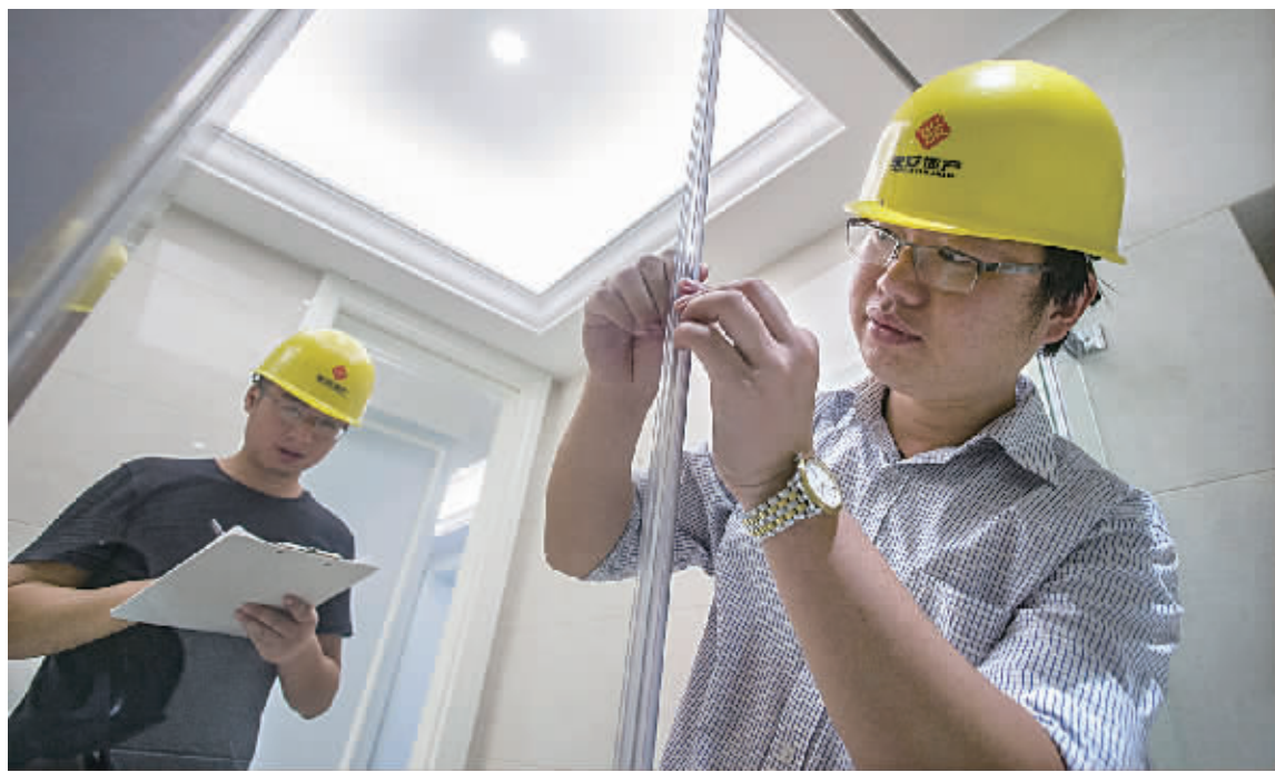
一个精装修楼盘的开发商组织人员进行装修施工。