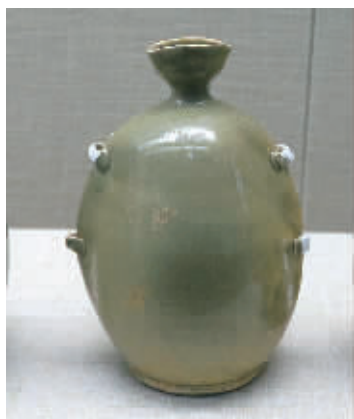
图为唐代越窑青瓷扁壶(荷花芯窑址出土)。

新世纪以来,宁波地域共开展重要聚落考古项目10项。通过余姚田螺山遗址的主动性发掘、慈溪董家岙遗址的小规模试掘和江北傅家山、镇海鱼山、象山塔山等遗址的抢救性发掘,大大增进了人们对宁波地域史前与商周文明的认知。现场展示的江北傅家山遗址出土的鹰形陶豆、镇海鱼山遗址出土的“笑脸”陶器耳等是宁波市民非