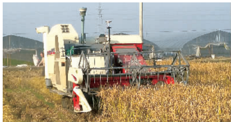
无人驾驶联合收割机正在收割晚稻。

笔者看到,这台无人联合收割机外形与普通联合收割机没有太大差异,只是在前方安装了巴掌大的方盒子和一个电子操纵杆,就是这个北斗卫星导航系统,使一台常见的联合收割机变成无人驾驶的联合收割机,工作人员只需发动收割