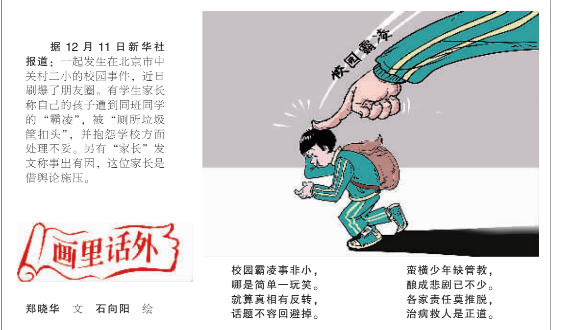
据12月11日新华社报道：一起发生在北京市中关村二小的校园事件，近日刷爆了朋友圈。有学生家长称自己的孩子遭到同班同学的“霸凌”，被“厕所垃圾筐扣头”，并抱怨学校方面处理不妥。另有“家长”发文称事出有因，这位家长是借舆论施压。

消除就业歧视并不排斥正常的人才竞争和优胜劣汰，厘清什么是就业歧视，我们才不会把就业歧视与人才竞争混为一谈。