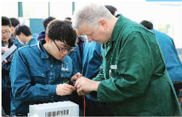
开展校企合作、现代学徒制

创业创新也是职业素养的重要一环。校园一条街为学生累积创业经验，中职学生带着淘宝店铺上大学成为宁波高职院校近年招生的一道风景线。宁波经贸学校就有11家这样的店铺，那是电子商务五年制专业33名同学的共同成果。这些店铺慢慢地开始盈利了，一名2014届的毕业生月收入超过2万元。这些学生通过考核直接升入宁波城职院。宁波职院零起点调研公司对近五年中