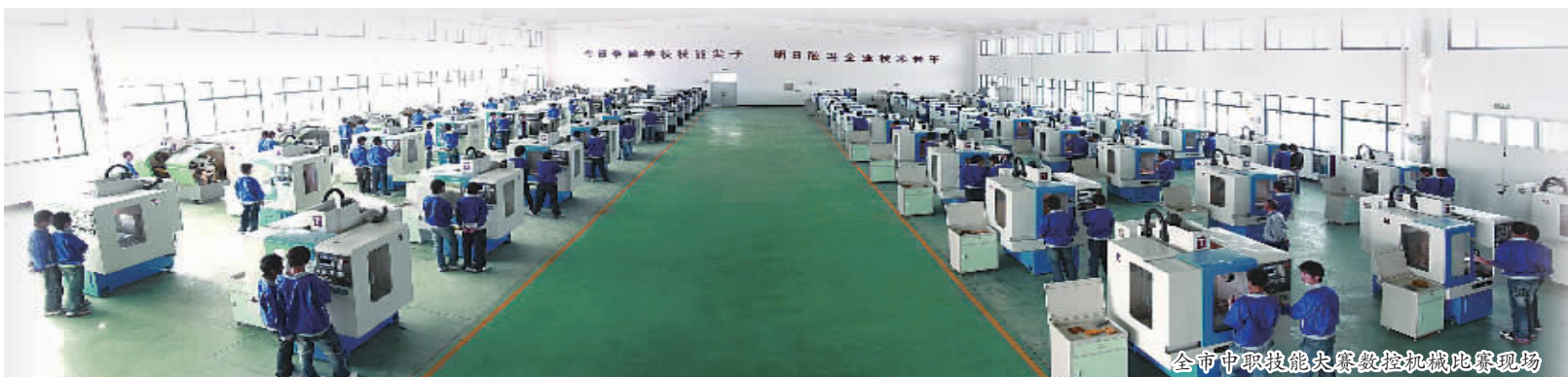
全市中职技能大赛数控机床比赛现场

面向新的时代，宁波职业教育一如既往地站在世界标准的高度，用精益求精的工匠精神，勇做中国职业教育的追梦人，攀登新的高峰！