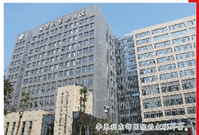
李惠利东部医院的大楼外景。