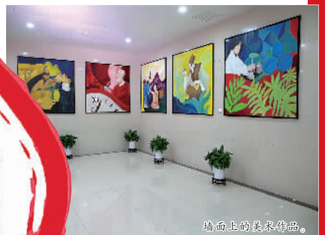
墙面上的美术作品。