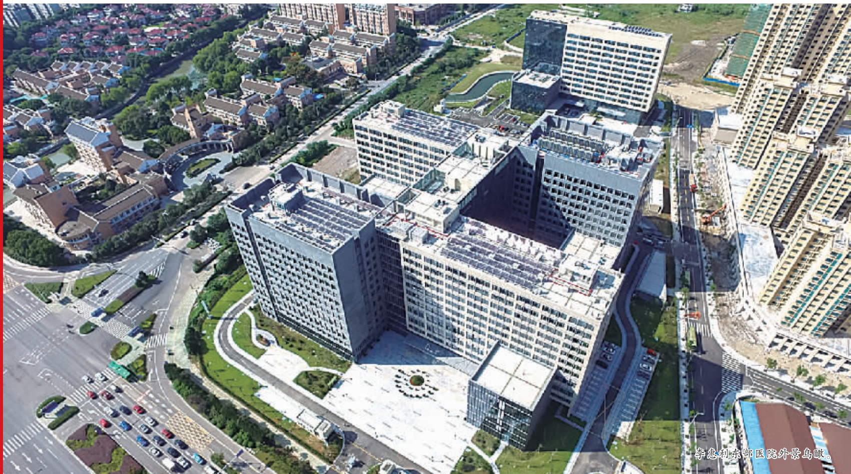
李惠利东部医院外景鸟瞰。

崭新的“去医化”医院风貌，和谐的“暖心化”医院氛围，温馨“周到化”医疗服务，这是李惠利东部医院给每一位来院者的印象，也成为了我市医疗服务的一道独特的风景线。