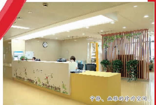
宁静、幽雅的治疗空间。