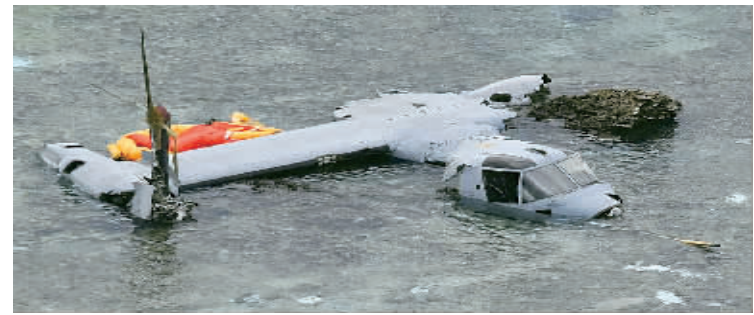
这是12月14日在日本冲绳附近海域拍摄的迫降的驻日美军MV-22“鱼鹰”倾转旋翼机残骸。

据日本媒体报道,驻日美军一架“鱼鹰”倾转旋翼运输机12月13日在冲绳附近海域迫降,5名机组人员获救,其中两人受伤。