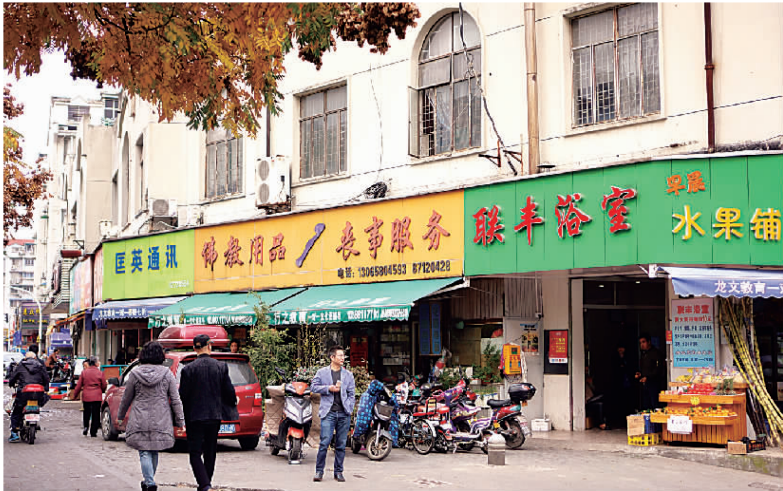
隐匿于市井的大众浴室。