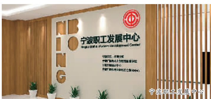
宁波职工发展中心

在广场西楼4层，“宁波职工发展中心”也将挂牌成立，负责统筹全市工会系统的职工学历教育、技能培训、技术比武、职工岗位创新、技师志愿帮扶的组织实施和服务指导等工作。宁波市五一培训学校、职工技术协会、技术交流站作为“中心”的具体办事机构，通过加大人力物力财力投入，增加注册资本，增扩办学场地，增添办学设施，增派精兵强将，以崭新面貌迎接广大职工朋友。“中心”同时吸收100家左右高校、职校、大中型企业、社会知名培训机构等作为加盟单位，多方联动，为全市广大职工有效搭建成长成才的大平台，进而全面优化我市工会系统在提升职工素质素养、助力职工成长发展方面的整体工作，培育造就更多的“港城工匠”和创新人才。