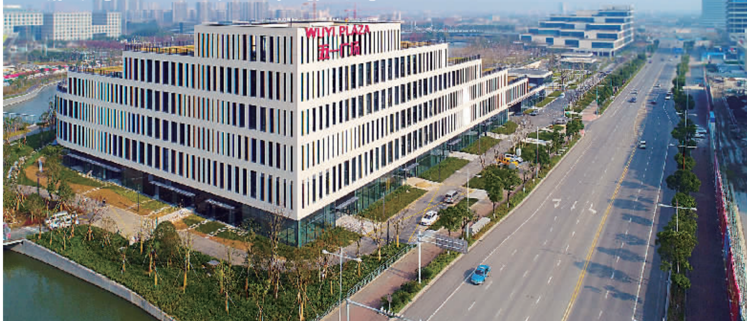
五一广场鸟瞰图。

两年前，宁波市新职工之家项目在东部新城破土动工，各级劳模和首席工人代表拿起铲子与建筑工人一起开工，用实际行动践行“我为职工之家出份力”的活动口号。短短两年后，正式命名为“五一广场”的职工之家已拔地而起，各文体场馆现已进入最后的设备调试阶段，随时准备以高标准软硬件服务接待各路来客。这是工会速度，也是工会品质。 今后五年，宁波将朝着加快建设国际港口名城，努力打造东方文明之都，高水平全面建成小康社会，早日跻身全国大城市第一方阵的宁波篇章追赶超越。与此同时，近年来各地兴起职工之家建设热潮。宁波市总工会顺应时代的号召，并以落实群团改革会议精神为契机作出积极的回应，新职工之家——五一广场在众人的期待中应运而生。