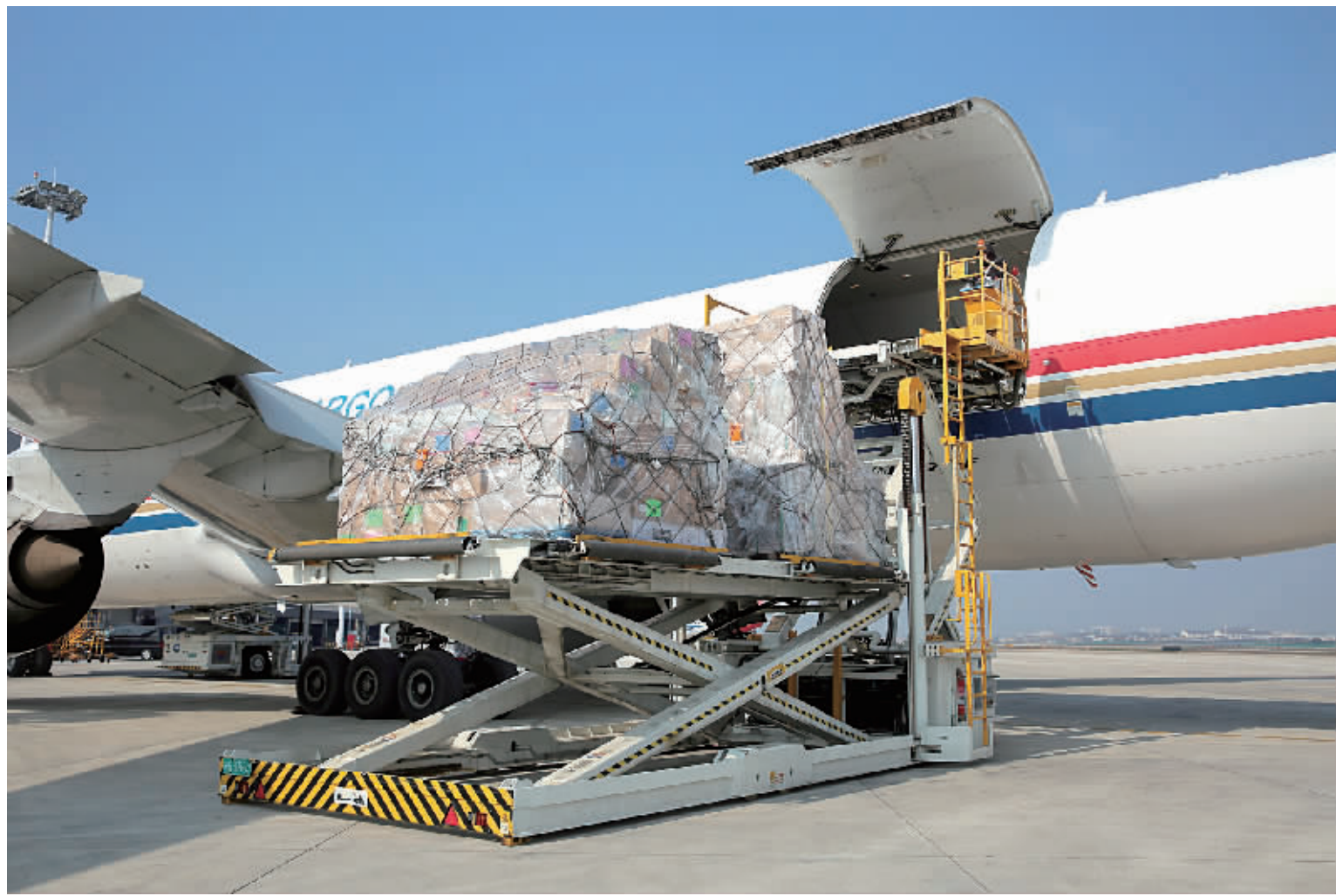
荷兰阿姆斯特丹全货机在宁波栎社国际机场卸货。