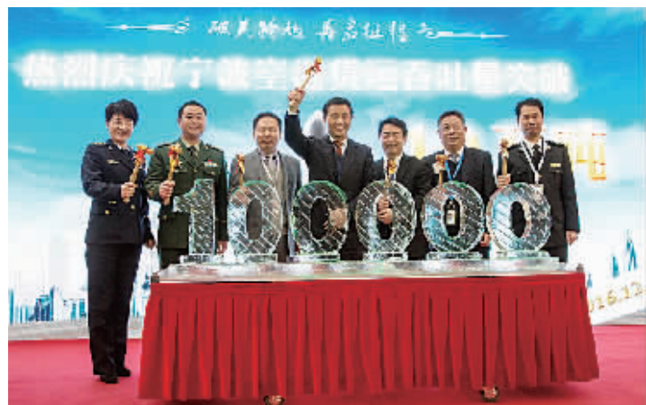
副市长王仁洲（中）举起十万吨“破冰”之锤。

宁波至台北航班是倍受宁波市民和商家欢迎的一条全货机航线，甬台两地地缘相近、人缘相亲，商贸文化交流不断升温，该航线不但提高了两地企业经济的交流效率，深化了甬台合作，加强了经贸往来，在甬台两地架起了沟通交流的空中桥梁，更为普通市民提供了能快速地享用到来