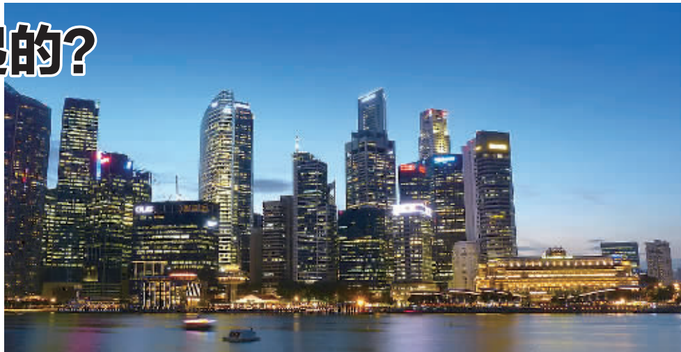
图为新加坡港口。(资料图片)

的地位。眼下,新加坡政府正在大力培育和发展海事集群基金,用于海事相关人才的引进。“新加坡是一个老龄化的国家,我们的航运人才非常缺乏,海事集群基金主要支持人才培养、人