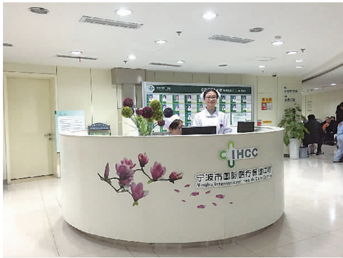
宁波市国际医疗保健中心的双语服务台。