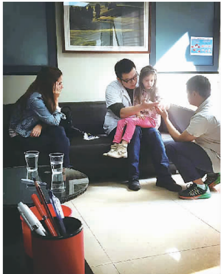
市二院的医生安抚外国小患者。