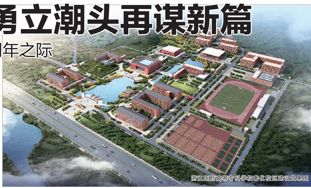
浙江医药高等专科学校崇化校区建设效果图

同时，该校与省食药监局下属的省食品药品检验研究院、省医疗器械检验院、省药品认证检查中心、省药品不良反应监测中心、省医药经济研究中心“两院三中心”等单位建立了战略合作关系，与全省食品药品监管系统实现了全面对接和资源共享，开展深度合作。以杭州奥默医药股份有限公司为依托单位设立的浙江药物一致性评价研究中心，致力于国内外仿制药一致性评价研究的现状和问题研究，为浙江省仿制药监管水平的提高和医药产业的发展提供决策建议和技术支持。以浙江英特集团为依托单位设立的浙江现代医药物流研究中心，为企业提