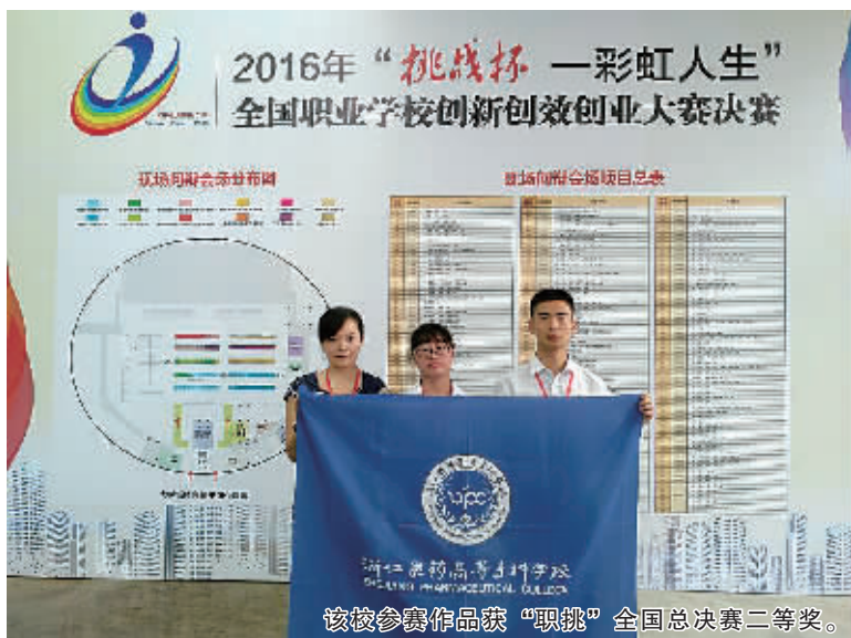
该校参赛作品获“职赛”全国总决赛二等奖。

三江寥廓春潮涌，卅年医药秋实丰。沿着奉化江潮流而上，一座“人文相守、山水相望、写意人文、百草芳香”的融入绿色发展理念的现代化大学校园即将诞生，届时，以自然山水为底蕴，构建写意、生态的校园空间，以药用植物为特色，营造绿色、科技的百草花园；融自然意、传统魂、现代骨于一体，形成一山、两轴、三脉、七区的景观结构，诸多元素共同营造绿色、人文、开放、大气的大学生校园，将为打造浙江乃至全国的医药、食品、药品、化妆品、保健品、医疗器械等高端应用性人才高地奠定坚实基础。